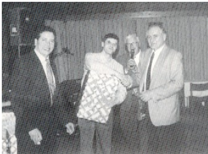
Un moment del sorteig dels regals cedits pels magatzems

Per acabar d'amenitzar la trobada, el músic Dani ens va oferir un esplèndid ball i ens va fer acabar a tots ballant la conga.