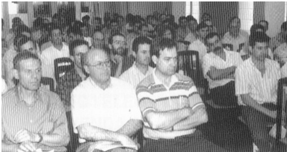
El Saló Nòrdic del Club Tennis Vic es va fer petit el dia de l'Assemblea.

Un centenar llarg d'associats van assistir, el passat dia 7 de juny, a l'assemblea general ordinària de socis d'AICO, que es va fer al Saló Nòrdic del club Tennis Vic.