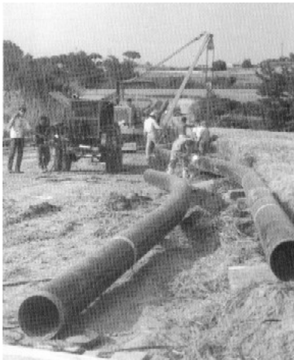
Les obres per l'arribada del gas a Osona es realitzen a bont ritme.

L'arribada del gas natural requeria una negociació amb l'empresa. El resultat va ser la incorporació d'AICO a la comissió de FERCA que negocia amb Gas Natural.