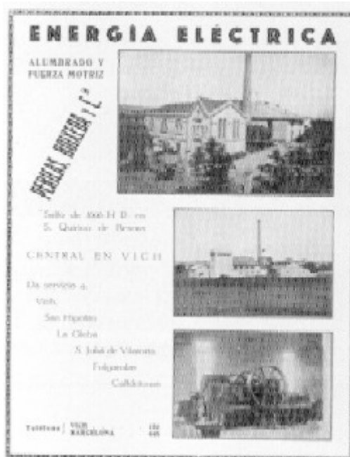
Aquest anunci el publicava la Guia Oficial de Vic de l'any 1927.

A la comarca d'Osona, l'any 1867 el propietari de La Coromina demana i obté permís: "per construir una resclosa que mogui un molí fariner". El 1874 el vigatà Josep Pericas Comella, demana i obté permís perquè aquella resclosa pugui moure telers i filoses mecàniques. Mentrestant, Thomas A. Edison inventava, a New Jersey, la làmpada d'incandescència i, l'any 1882, construïa a Pearl Street, Nova York, la primera Central Elèctrica que repartia electricitat a domicili, amb una potència de 90 kw.