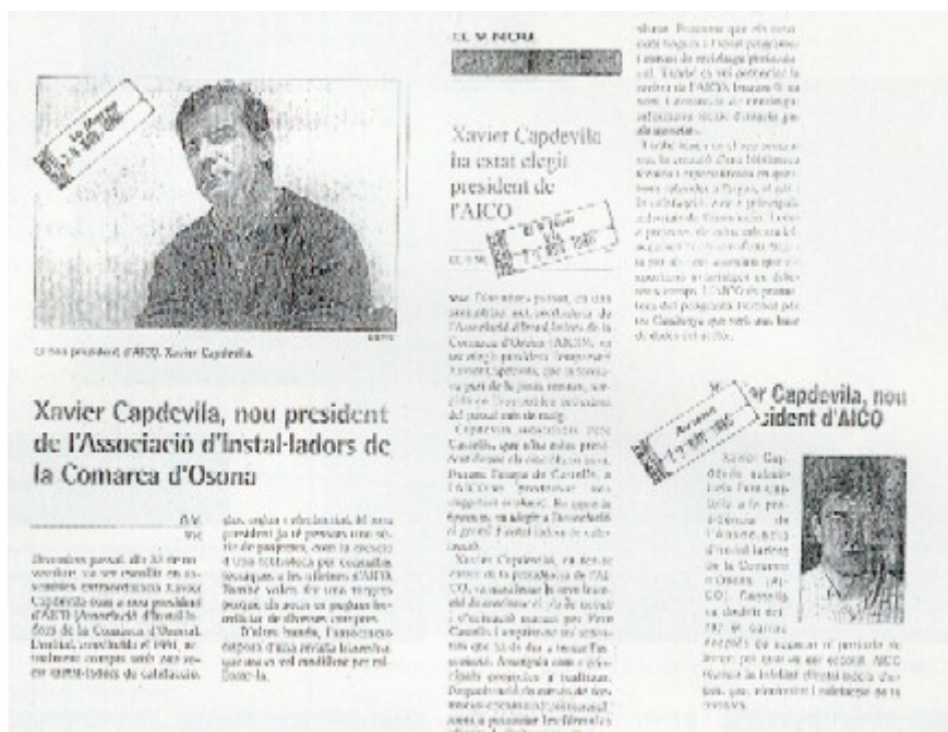
Tota la premsa d'Osona es va fer ressò del canvi a la presidència d'AICO.