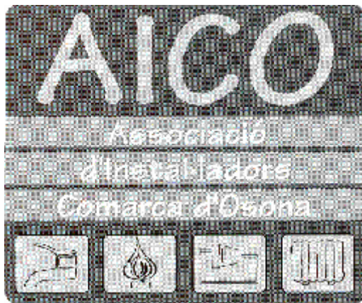
Aquest és un model del nou anagrama d'AICO.

La simbologia és important en l'època actual, és per això que la Junta ha volgut posar-se al dia en l'aspecte extern d'una Associació que té la voluntat d'afrontar el repte del futur en les millors condicions possibles.