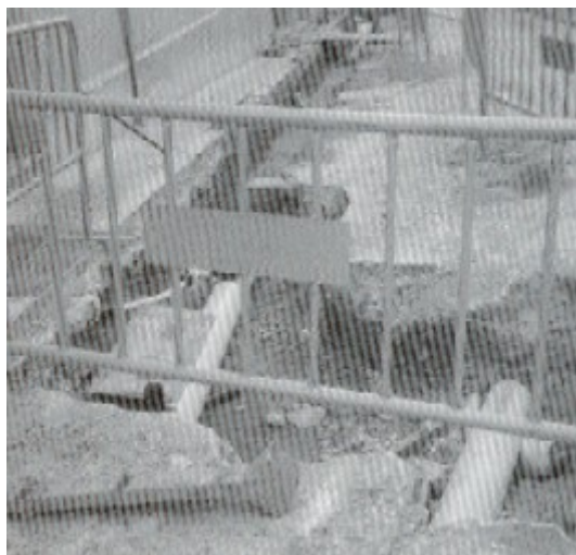
L'arribada del gas natural a la comarca ha provocat alguns problemes.