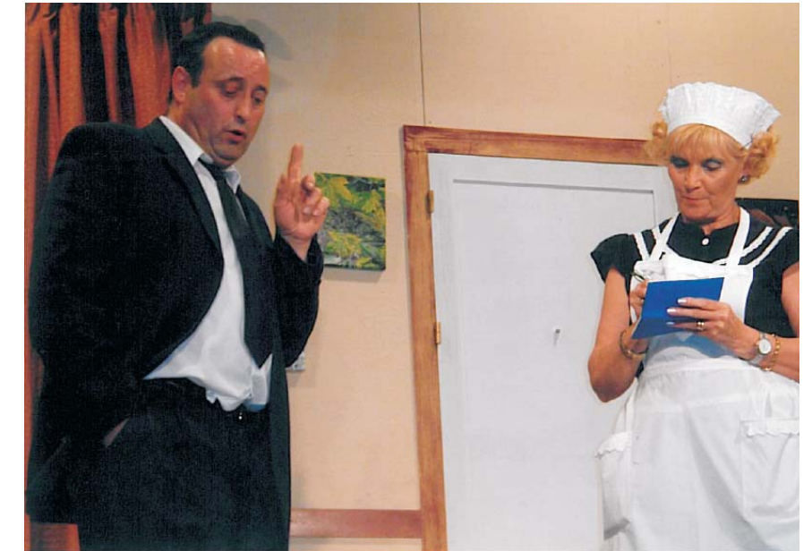
L'Albert amb una companya representant l'obra "Políticament incorrecte".

http://musicalaprendrepelsa.c.blogspot.com/