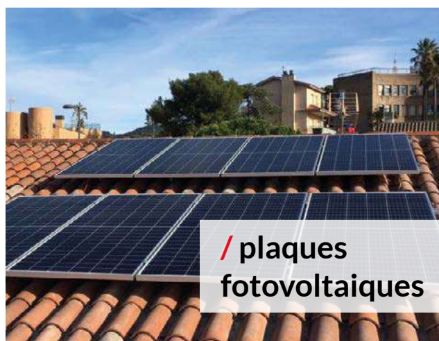
/ plaques fotovoltaiques