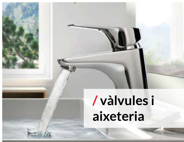
/ vàlvules i aixeteria