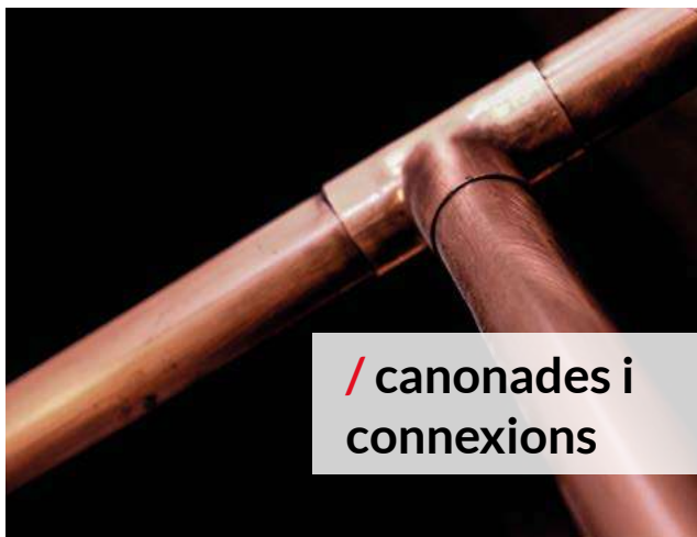
/ canonades i connexions