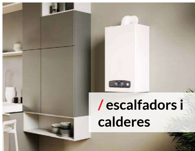
/ escalfadors i calderes