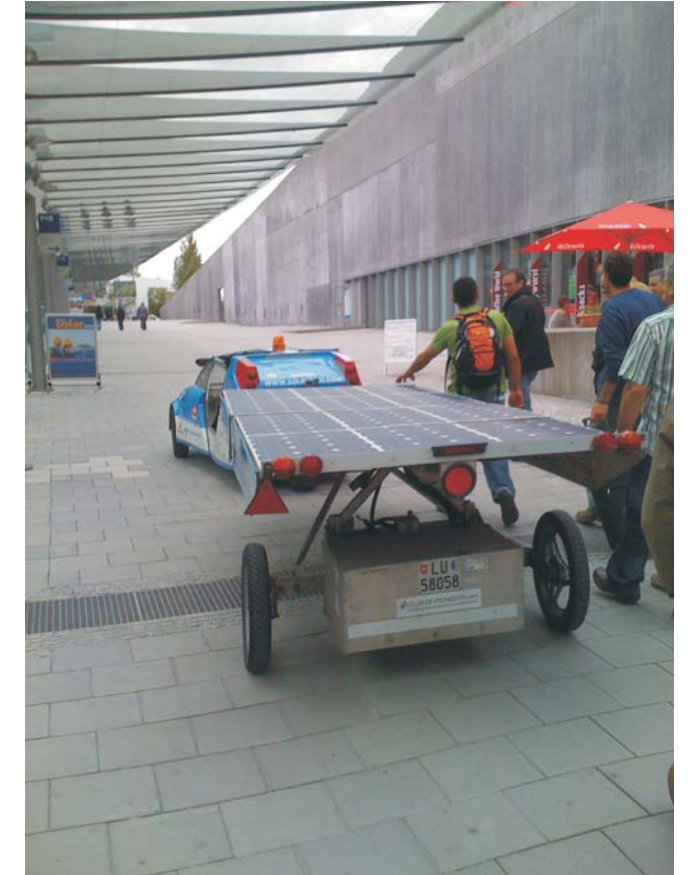
Es va marxar de Vic el dia 27 a les 6 del matí i es va tornar el dia 29 a les 23:30 de la nit, o sia, que va ser un viatge súper intens.