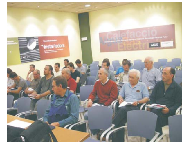
Classificació, verificacions i inspeccions

Es va lliurar un dossier amb més informació que teniu disponible al gremi.