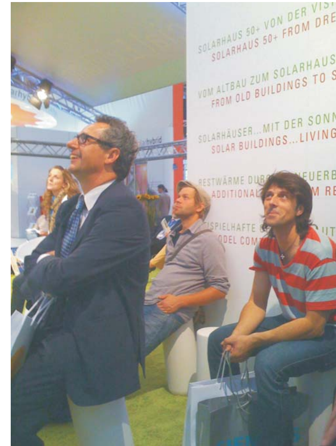
La fira es va celebrar els dies 27, 28 i 29 de maig.