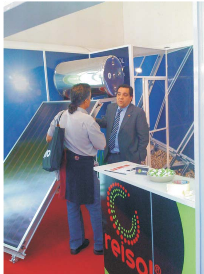
Els instal·ladors van poder veure les darreres novetats en energia solar tèrmica i fotovoltaica.

Per aquesta edició, es va comptar amb l'ajut de la Cambra de Comerç, que mitjançant un conveni que es va signar amb AICO, va col·laborar amb una subvenció d'aproximadament 250 € per participant.