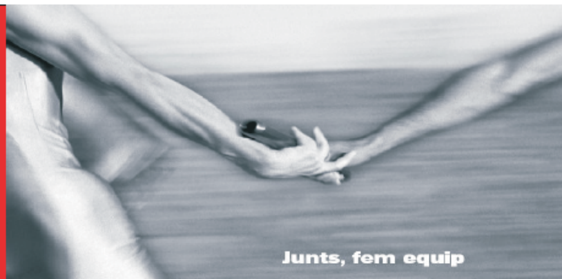
Junts, fem equip